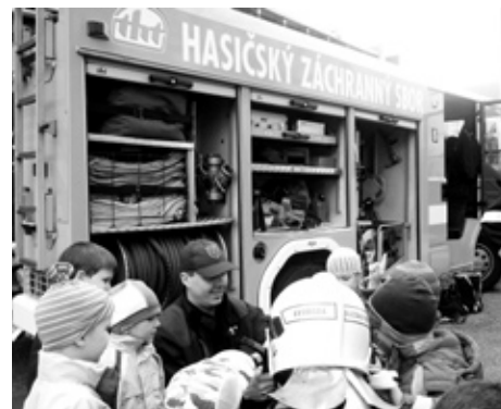
■ Hasičský vůz. To bylo něco!

Během tohoto zábavného dopoledne byly dětem připomenuty získané poznatky z předešlé besedy. S hasiči z integrovaného výjezdového centra vedly děti diskusi o jejich práci, která byla spojena s prohlídkou výstroje, praktickou zkouškou zdravotního límce, hasičské helmy apod. V areálu MŠ byla pro naše děti připravena prohlídka hasičského auta