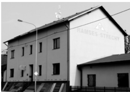
■ Sídlo firmy RAMSES OSTRAVA spol. s r. o.

střechy hradů Karlštejn, Nové Zámky a Bouzov nebo kostelů ve Staříči, Libavě, Ostravě (evangelický kostel). Radvanický punc mají i prejzová střecha letohrádku Hvězda a Schwarzenberský palác v Praze, Nová radnice v Ostravě a Ostravské muzeum, střechy supermarketů Carrefour v Ostravě, Žilíně a Brně, koleje Univerzity Palackého v Olomouci a další.