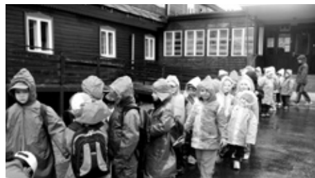
■ Déšť nikomu nevalil

Pobyt v přírodě je pro děti velkým zážitkem. I když zde děti pobývají bez rodičů, přesto se na něj velice těší. Ozdravný pobyt dětí z Mateřské školy Radvanice proběhl ve dnech 11.–15. 4. 2011 v areálu horské chaty Bílá v Beskydech.