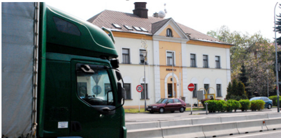
■ Ulicí Těšínskou projíždějí denně stovky nákladních aut