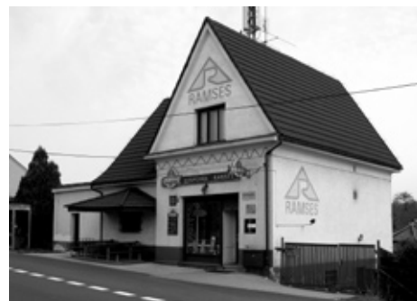
■ Hospůdka Ramses.